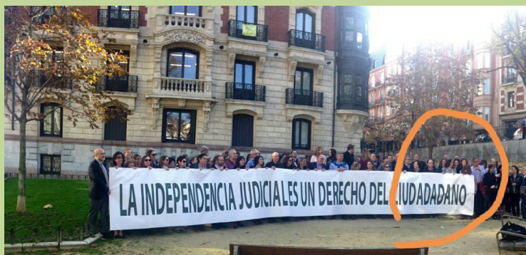
Acto reivindicativo en la ciudad de Bilbao

El súbito incremento de asociados a FJI ha llevado a la Gestora Nacional a adoptar medidas drásticas en el reciente Congreso Nacional celebrado en Bilbao. Ante la imposibilidad de que todos los asociados presentes se situasen detrás de la pancarta reivindicativa elaborada para la ocasión, se decidió duplicar la tercera sílaba de la palabra “ciudadanos”, alargando así la pancarta para que entrasen todos. La presidenta de la asociación ha destacado que, de esta forma, se pone de manifiesto el compromiso de FJI con toda la “ciudadanía”.