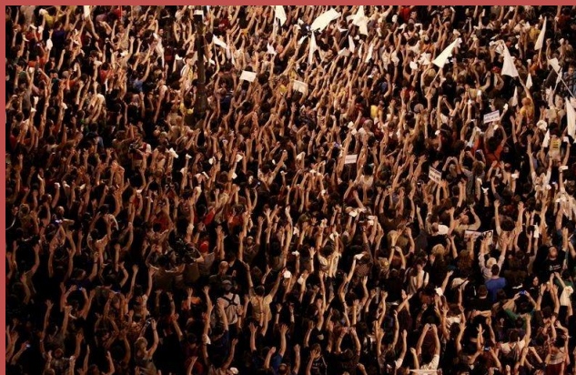
Los magistrados participantes en la encerrona, iniciando el tercero de los cánticos.

Al final, dos horas y 55 minutos de una encerrona típica de los inspectores de esta Unidad y no se produjeron expedientes de consideración; solo tres informativas, una por sentencias pendientes; otra, por pleitos pendientes de pronunciarse sobre las pruebas, con posible archivo en tres meses; y la tercera, por escasez de señalamientos. A pesar de ello, una encerrona tranquila, resbaladiza y emocionante de los inspectores de la siempre peligrosa Unidad Inspectora Contencioso-Administrativa.