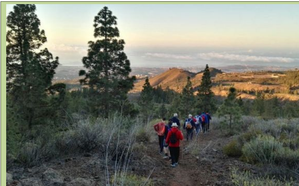
Procesados por el tribunal germano dirigiéndose a Tomelloso

El titular del juzgado nº 1 de la citada localidad ha dictado un auto en el que anula las sentencias dictadas en el último año por el Tribunal Superior de Justicia del citado Land. El juez invoca, como motivo fundamental para anular las citadas resoluciones, que el tribunal vulnera los derechos de los ciudadanos sometidos a su jurisdicción. “Es evidente –razona la resolución– que un tribunal que se califica a sí mismo como Oberlandesgericht y que dice situarse entre el Bundesgerichtshof y el Landgericht , impide un adecuado ejercicio del derecho de defensa, pues la sola invocación del nombre vulnera el derecho a un proceso sin dilaciones indebidas”. Cientos de imputados y condenados de Maguncia, Coblenza y Ludwigshafen (las tres principales ciudades del Estado) se dirigen a la localidad manchega a solicitar el amparo del juzgado. El Tribunal Supremo español, por su parte, ha emitido una escueta nota dirigida al Tribunal alemán con el siguiente contenido: “A que j...”.