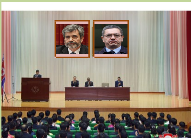
Imagen del emotivo acto

Necesitaríamos el solar de toda España para esta inmensa manifestación de entusiasmo, de unidad y de firmeza, que da la más expresiva y rotunda respuesta a quienes en el exterior especulan torpemente con vuestra lealtad y con vuestra paz interna ( clamorosos aplausos ). Los que en la impunidad intentan injuriarnos –esa Plataforma y las asociaciones de siempre–, queriendo quitar a los jueces la gloria de su Victoria ( extraordinarios aplausos ) y el mérito de sus sacrificios, para hacerlos recaer precisamente en un puñado de sus odiados enemigos ( grandes aplausos ), con la injusticia tiran sobre sí mismos un baldón de ignominia. ( Clamorosa ovación. La voz de un presidente de Audiencia: “Aquí estamos para impedirlo. Más palo y menos zanahoria” ). Por vosotros y por vuestro sacrificio, el universo entero es testigo de la señal inequívoca de que, en la España judicial, empieza a amanecer... ( Ovación cerrada durante largos minutos ). ¡Por la política, hacia el Consejo! ¡Por el Consejo hacia el Constitucional!”.