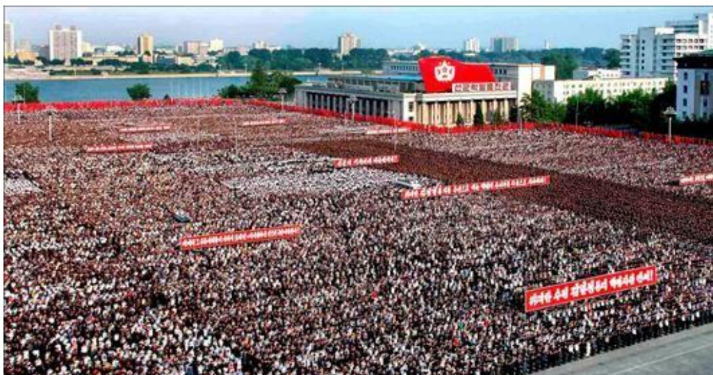
Imagen de la manifestación espontánea de ciudadanos norcoreanos en apoyo del Promotor de la Acción Disciplinaria

Regímenes totalitarios de todo el mundo han mostrado su apoyo al CGPJ y al Promotor de la Acción Disciplinaria en el asunto de las diligencias secretas. Altos mandatarios de Corea del Norte, Cuba, Irán y China han lamentado el acoso al que se está sometiendo a la institución española y han defendido su actuación alegando que el expediente secreto es el único medio que garantiza que el interesado no se entere, y facilita la acumulación de pruebas contra el mismo.