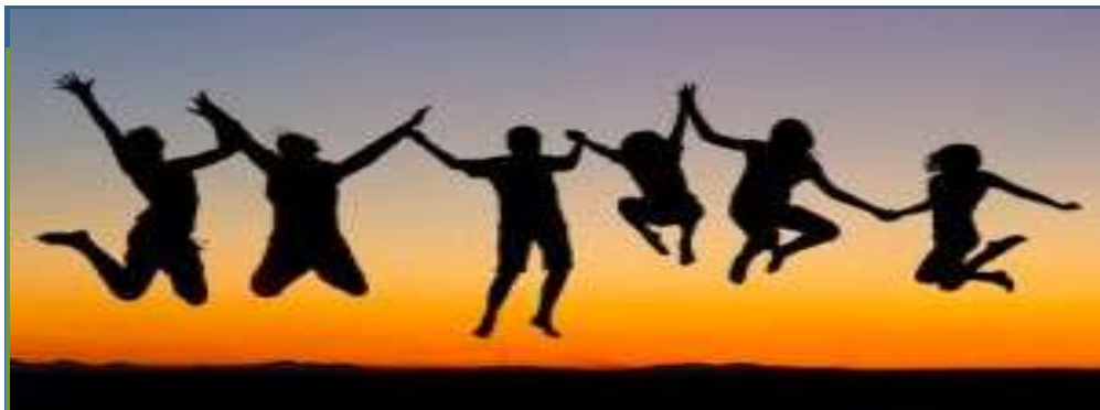
Magistradas y Magistrados de Audiencia Provincial celebran la noticia